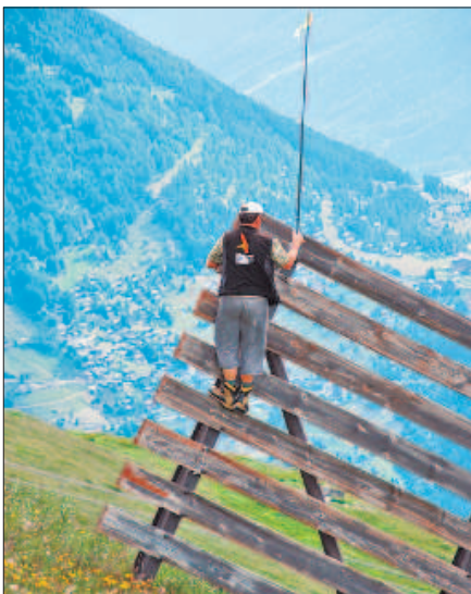
Der «Spion» zeigt die Windrichtung an.