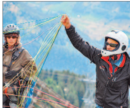
An diesen Leinen hängen Pilot und Passagier.