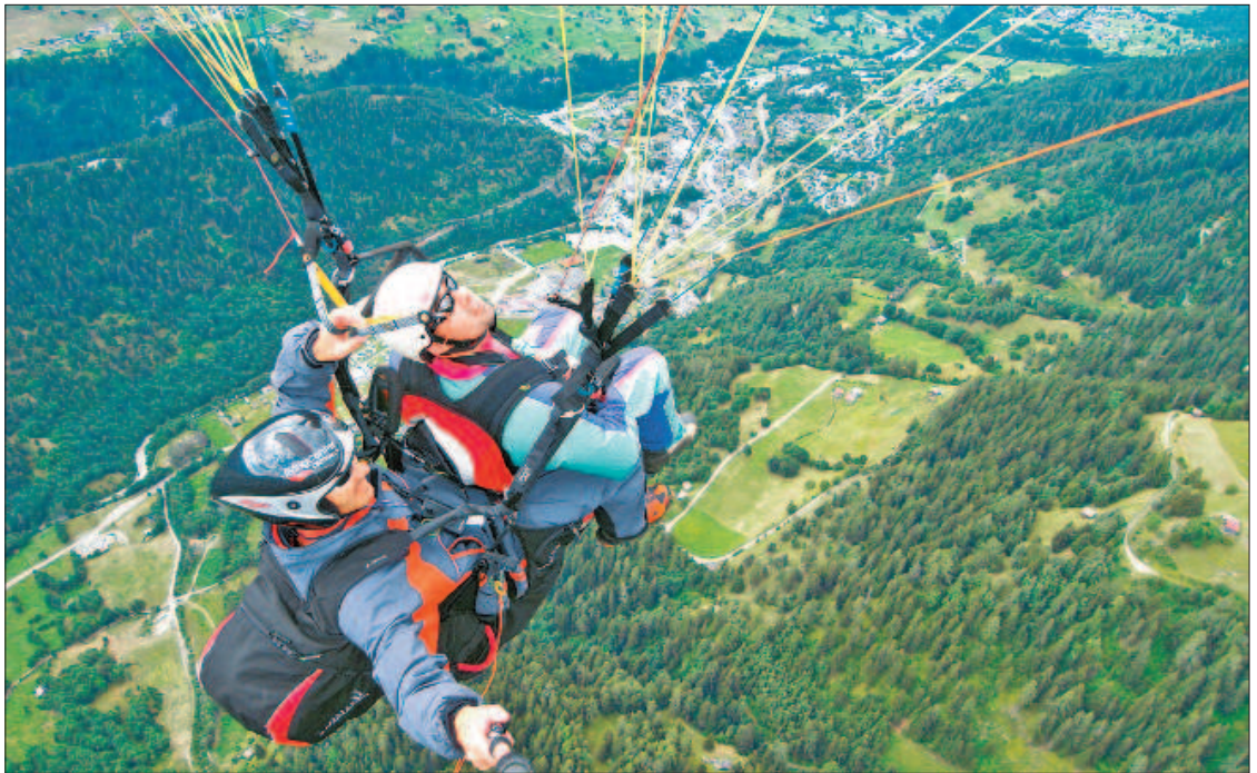
Die Welt von oben. Schwindelfrei sollte man beim Gleitschirmfliegen schon sein.

Der Gleitschirm hat seit den Anfängen eine rasante Entwicklung genommen. Moderne Materialien und ausgeklügeltes Design verlei- hen den Schirmen schier unglaubliche Flugeigenschaften. Die neuesten Modelle kommen auf ein Gleitverhältnis von 1:10. Das Fluggerät legt unter dem Verlust von einem Meter 10 Meter zurück.